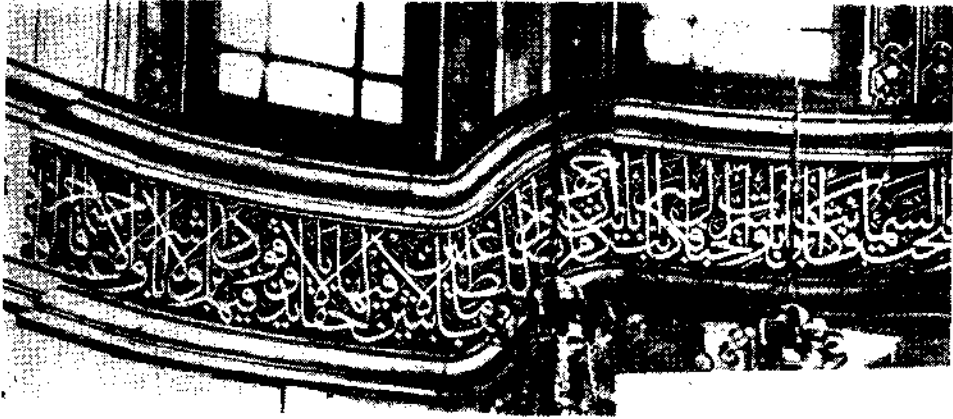
Resim 4 — Nusretiye Camii içinde Mustafa Râkım'ın kuşak yazısı. (Nebe sûresi).

Yukarıda söylediğimiz gibi Celi Sülüs, Mustafa Râkım (Ölümü : 1826) adlı meşhur hattat tarafından olgunluğa kavuşturuldu. Harflerde duruş güzelliğini ve yazının bütününde istif denen kompozisyonu o temin etti. Onun san'at dehasını anlamak için İstanbul'da Fâtih'te II. Sułtan Mahmud'un anası Naksîdil'in türbesindeki ve Tophânede Nusretiye Câmî'i'nin (İnsâ tarihi : 1241/1826) içindeki yazılarına bakmak kâfidir. [Resim. 4]