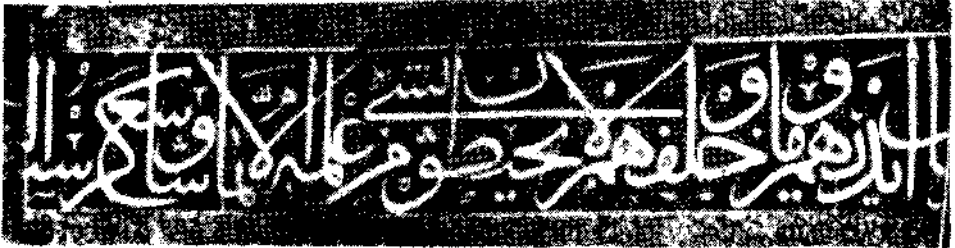
Resim 3 — Topkapı Sarayının içinde bulunan Bağdat Köşkü'nün pencereleri üstünde Âyetü'l-kürsi (şûre: 2, âyet: 256).

XVII. yüzyıldan itibaren Osmanlı Celi yazısında, harflerdeki dik ve sert duruşlar yavaş yavaş kaybolmaya başlar. Buna son tipik misal olarak IV. Murad zamanında Topkapı Saray'ında 1639 da yapılan Bağdat Köşkü'nün yazılarını gösterebiliriz. Köşkün alt ve üst pencereler arasından geçen kuşakta lacivert zemin üzerine beyaz olarak yazılmış olan Âyetü'l-Kürsi'nin dikey harflerinde sola doğru hafif bir meyil görüldüğü gibi, harflerde ve yazının bütününde de bir yumuşaklık ve tatlılık göze çarpar. [Resim 3]