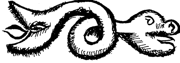
Şek. 3- Anamur Ak Cami'de Alaeddin Keykudad devrinden Kitabenin altında ejder tasviri (G. Öney)

İslâm Eserleri Müzesi Env. No: 102'de kayıtlı olan tek düğümlü stilize olmuş ejder figürünü bronz ibrik üzerinde de izleyebiliyoruz (Şekil 4) (14).