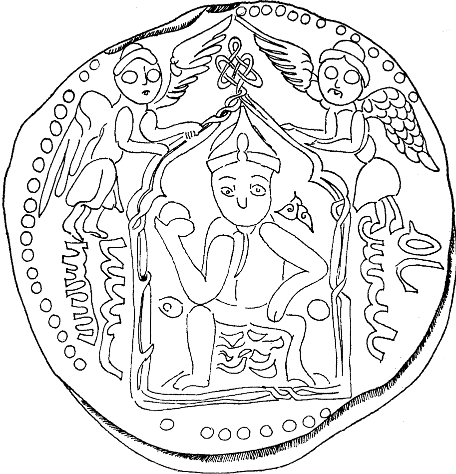
Şek. 5- Bakır Sikke, İstanbul Arkeoloji Müzesi Env. No: 1205.

1180 tarihli Artuklu bölgesinden gelme, Nür el Din Muhamet adına kesilmiş olan bakır sikke üzerinde (İstanbul Arkeoloji Müzesi İslâmi Sikkeler seksiyonunda 1205 envanter numara ile kayıtlı) taht üzerinde oturmuş sağ elinde hükümdarlık sembolü olan küre bulunan, sol elini ise dizine dayamış (Şekil 5), başında sivri uçlu başlığı (ser-