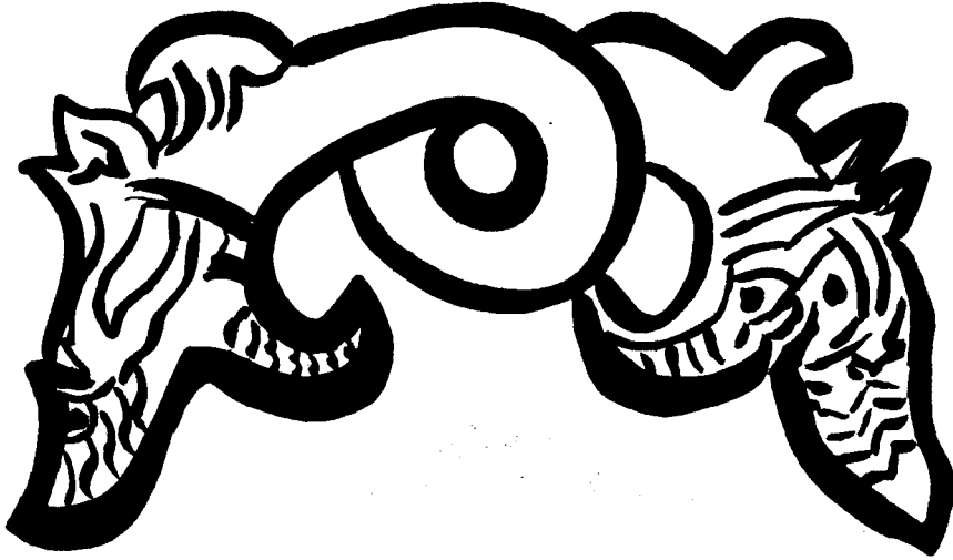
Şek. 2- Ahlat Mezartaşında ejder tasviri

Örneğin : Kırmızı tüften yapılmış ve Meydanlık kabristanının orta kısmında dikdörtgen şeklinde uzun lahit 13 yy. a tarihlenmektedir. Dikdörtgen şeklinde çıkıntılı panonun ortasında düğümlü, kulaklı, iki başlı ejder yer alır. Ejder başları aşağı doğru kavis yapmaktadır (Şekil 2).