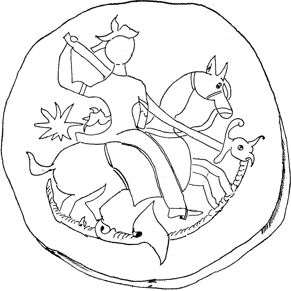
Şek. 1- Bakır Sikke, İstanbul Arkeoloji Müzesi Env. No: 1068

iki ayaklı, açık büyük ağızlı dili sarkan ejderin üzerine binmiş profilden görülen süvari figürü yer alır. Kısa, dışa kıvrık saçlı figürün bedeni çıplak, beli uçkurla bağlı uzun pantolon giymiş ve sol elinde dişli çatalı havaya kaldırmıştır. Ejder yer altı ve karanlığı sembolize ettiğine göre bu kompozisyonda süvarinin karanlığa karşı zaferini simgeler (Resim 5). Topkapı Sarayı Müzesi'nde 2/1792 env. numara ile kayıtlı olan ve 13. yy.'a ait Anadolu menşeli altın kakma tekniği ile yapılmış bir çelik ayna üzerinde Şahin'le avlanan avcının atı-